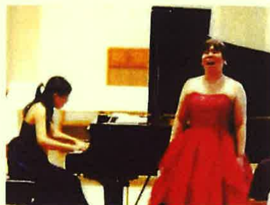
第74回チャペルコンサートより