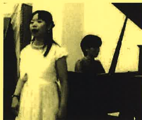
第75回チャペルコンサートより