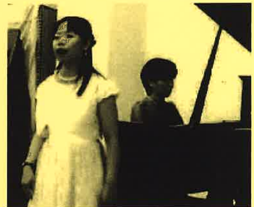
第75回チャペルコンサートより