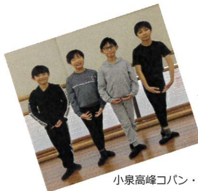
小泉高峰コパン・ド・バレエ