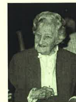
故カニングハム女史